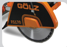
Nouveau carter de \varnothing 500 mm et profondeur 190 mm