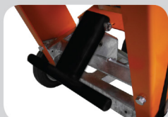
Plongée par pédalier