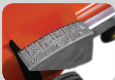
Indicateur de direction et de profondeur de coupe